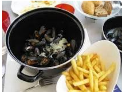
Moules – Frites.

Vor Frue Katedral, med dets 123 m høje spir.